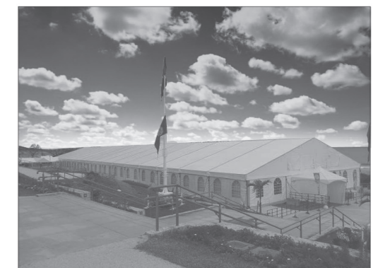
▲沖縄国際洋蘭博覧会