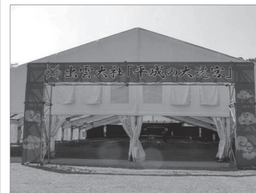
▲出雲大社 平成の大遷宮

大型テントレンタル及びテント工事・全国のスポーツ大会・地域の産業祭・市町村の夏祭りや運動会・神事・式典などあらゆる催事の会場設営から運営まで。イベント総合プロデュース企業